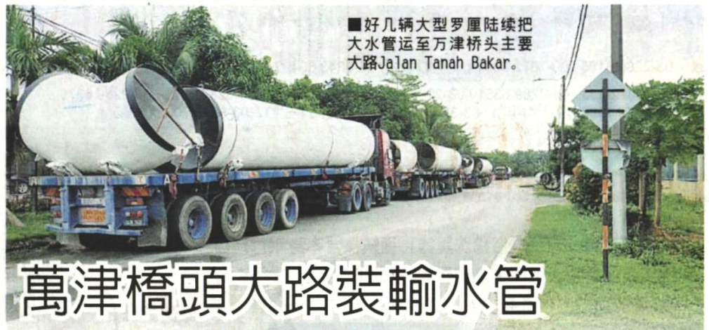
■好几辆大型罗厘陆续把大水管运至万津桥头主要大路Jalan Tanah Bakar。