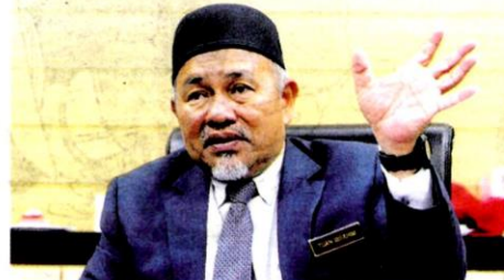
By Nurul Suhaidi The decision to degazette KLNFR or any existing forest reserve in Malaysia will affect the target to reduce 45% of carbon intensity (per GDP) by 2030, Tuan Ibrahim says

"However, to date, no EIA report has been submitted to the Department of Environment (DoE) on issues involving development proposals in the Sungai Panjang Per-