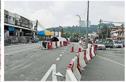
↑路陷发生后，布雅马瓦路（图左）从星期一开始全面封锁，从六福园往布雅拉也路或第二中坏公路则取道茉莉花1路（图右）。