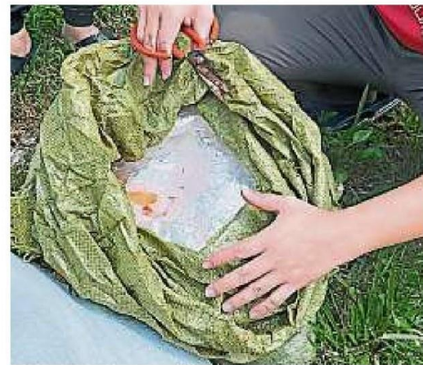
怀疑是网卖业者从海外订购大批商品，拆掉包装袋后，把不要塑料袋乱丢。