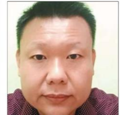
Wong: Only 112,400 individuals are vaccinated under Selvax Community programme.