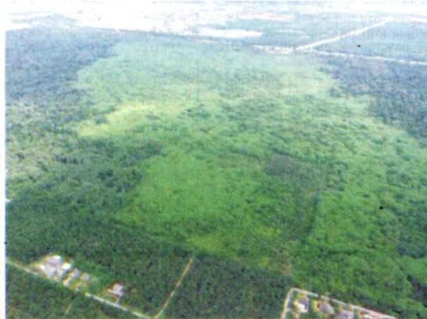
IMEJ HSKLU seluas 536.7 hektar yang dikaitkan isu dinyahwartakan.