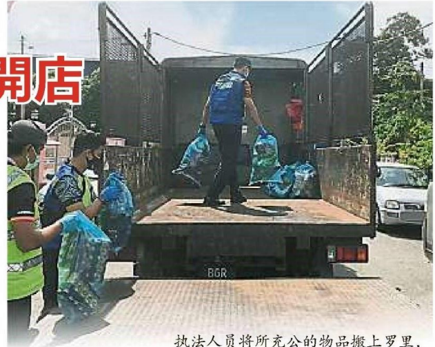
执法人员将所充公的物品搬上罗里，准备载返巴生市议会。

他说，经调查发现，该杂货店并没任何营业执照，因此市议会援引2007年贸易、商业及工业执照条规，充公所有物品。