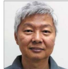
Soon: Selangor government must give a full and detailed financial report on the Selvax programme.

He also referred to a news report on July 1 which quoted Amirudin, who assured the private sector that "the government was not profiting from the sale of vaccines, as the price that employers pay only covered management costs and the vaccines were subsidi-