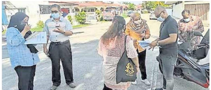
■一些邻里纠纷问题涉及多个单位，市议会有时候也会召集其他小组官员，一同协调。

(巴生7日讯) 巴生多数花园住宅区都以排屋形式为主，每户住家都有“邻居”，好的邻居可守望相助，不好的邻居分分钟动辄互相叫骂，更严重情况酿肢体冲突。