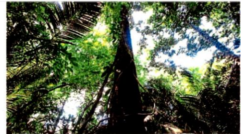
The Kuala Langat North Forest Reserve in Selangor. FILE PIC

On the proposed development near the Sungai Panjang Forest Reserve in Sabak Bernam, Tuan