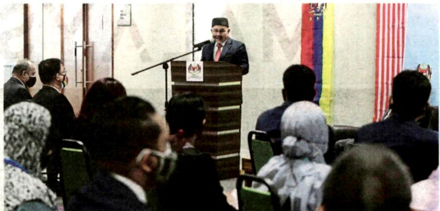
Tuan Ibrahim ketika menyampaikan amanat sasaran utama 100 hari Kementerian Alam Sekitar dan Air kepada pengurusan tertinggi kementeriannya di Putrajaya, semalam.