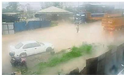
双溪巴高淡峇汉区的工厂和住宅逢雨必淹。